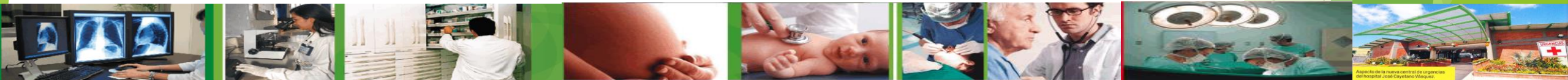
Aspecto de la nueva central de urgencias del Hospital José Cayetano Viquez.